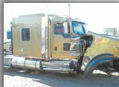
Camions complets accidentés à coûts modiques