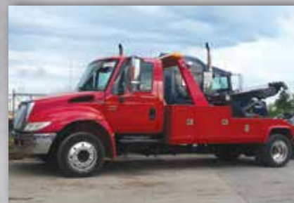
Remorqueuse avec système hydraulique