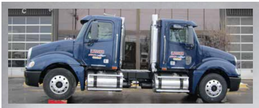
Camions jumelés pour les centres de formation ayant des espaces restreints.

Concessionnaire de cette marque fort réputée de camions neufs de prestige , Camions EXCELLENCE PETERBILT se distingue par la qualité de son service à la clientèle aussi impeccable que la qualité de ses véhicules. En constante évolution depuis sa création en 1997, cette filiale du Groupe Lussier est désormais implantée à Sainte-Julie, Laval et Drummondville, sans compter son centre de services situé à Saint-Jacques-le-Mineur.