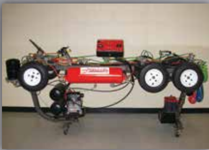
Banc de freins ABS avec simulateur de problèmes