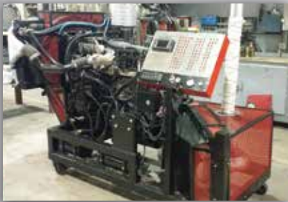
Moteur Maxforce 10 sur banc avec simulateur de problèmes