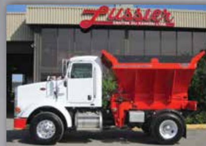
Camion spécialisé avec accessoires hydrauliques ajoutés