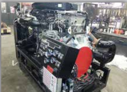
Moteur Detroit DD15 avec système DPF et boîte pour la prise de lectures (Pin out box)