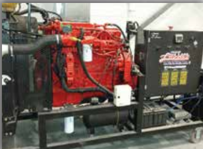
Moteur Cummins ISB sur banc avec système à l'urée et simulateur de problèmes