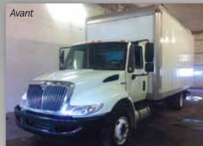
Camion avant les modifications effectuées pour les besoins d'un centre de formation