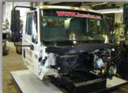
Cabine sur banc pour accessoires cabine et système électrique