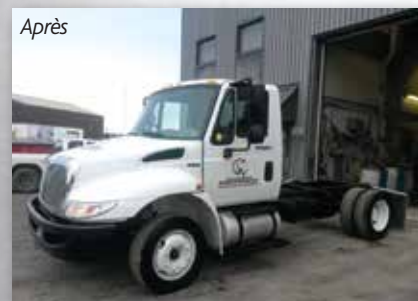
Camion modifié et raccourci pour la formation dans des espaces limités